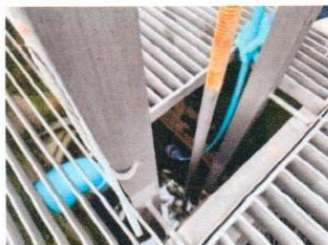
จุดที่ 3 บริเวณบ่อดักขยะและตรวจคุณภาพน้ำทิ้ง