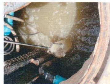
จุดที่ 2 บริเวณส่วนแยกกากของระบบบำบัดน้ำเสีย