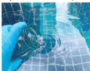
จุดที่ 5 บริเวณสระว่ายน้ำ ส่วนลึก