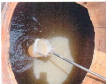
จุดที่ 3 บริเวณบ่อพักน้ำใสของระบบบำบัด น้ำเสียชุดที่ 1