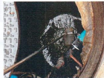
จุดที่ 2 บริเวณส่วนแยกกากของระบบบำบัดน้ำเสีย