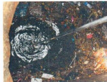
จุดที่ 4 บริเวณบ่อพักน้ำแรกที่ออกจากระบบบำบัด น้ำเสียสำเร็จรูปชุดที่ 2