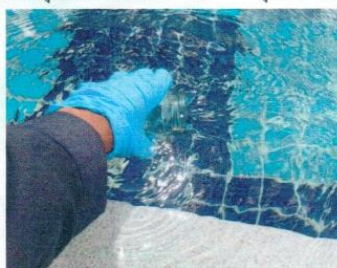
จุดที่ 7 บริเวณสรวายน้ำ ส่วนลึก