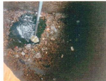
จุดที่ 4 บริเวณบ่อพักน้ำแรกที่ออกจากระบบบำบัด น้ำเสียสำเร็จรูปชุดที่ 2