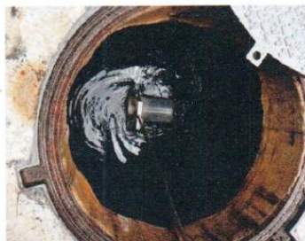
จุดที่ 3 บริเวณบ่อพักน้ำใสของระบบบำบัด น้ำเสียชุดที่ 1