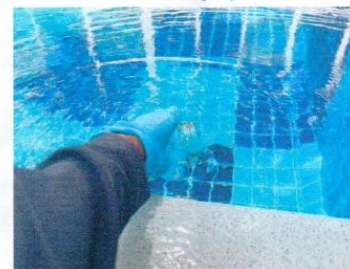
จุดที่ 6 บริเวณสรวายน้ำ ส่วนต้น