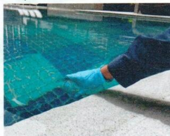
จุดที่ 7 บริเวณสระว่ายน้ำ ส่วนเล็ก

ใบรายงานผลการทดสอบรับรองเฉพาะตัวอย่างที่ได้รับการทดสอบเท่านั้น