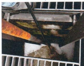
จุดที่ 5 บริเวณบ่อดักขยะและตรวจคุณภาพน้ำทิ้ง