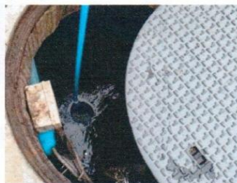
จุดที่ 1 บริเวณบ่อพักน้ำใสของระบบบำบัด น้ำเสียชุดที่ 1