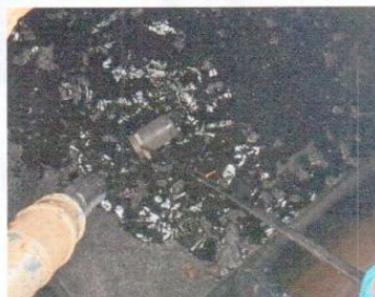
จุดที่ 1 บริเวณบ่อเกรอะของระบบบำบัดน้ำเสีย