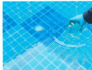
จุดที่ 4 บริเวณสระว่ายน้ำ ส่วนต้น