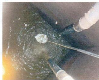
จุดที่ 1 บริเวณบ่อเกรอะของระบบบำบัดน้ำเสีย