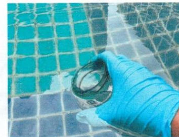
จุดที่ 6 บริเวณสระว่ายน้ำ ส่วนต้น