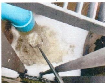
จุดที่ 5 บริเวณบ่อดักขยะและตรวจคุณภาพน้ำทั้ง